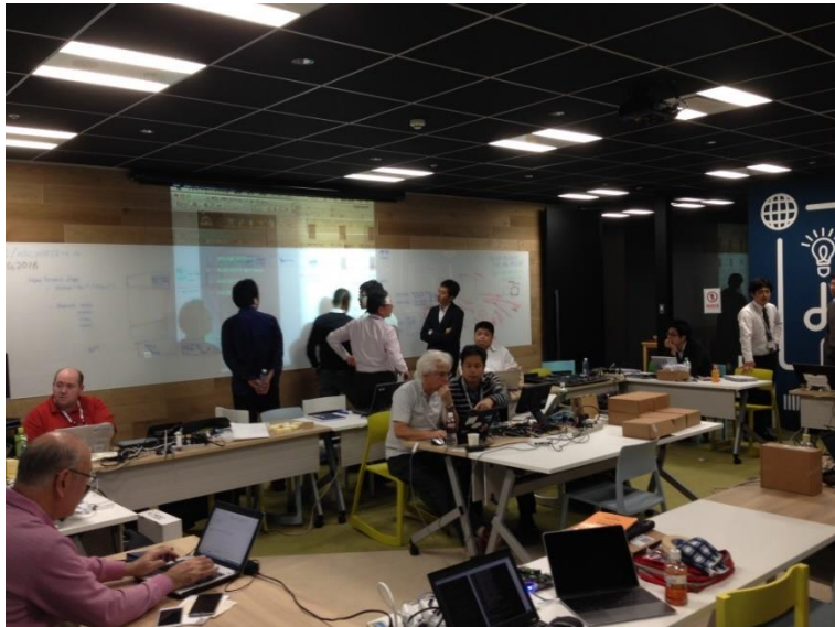
インテグ合宿@横浜